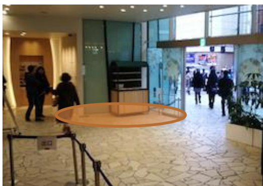
※雨天時、館内利用も検討可能